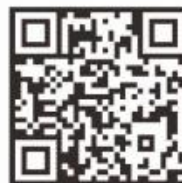
真瑞生物 官方网站

电话: 0755-26582639 传真: 0755-26582890 网址: www.zr-bio.com 邮箱: zhenruibio@163.com 地址: 深圳市龙华区清宁路1号