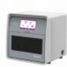
全自动核酸提取仪