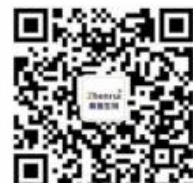
真瑞生物 微信公众号